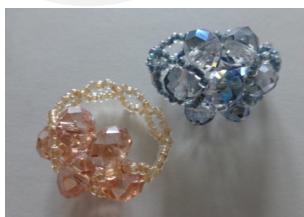
Aフルールリング作り