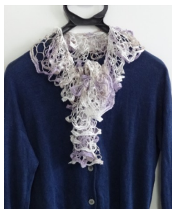
B指あみフリルスカーフ作り